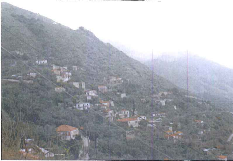
Φωτογραφία 8 : Άποψη του «Σταυρού» . Στην κορυφή ο «Αγ. Αντώνης»

αμάραντο. Επιστρέφοντας, μοιράζουν από ένα λουλούδι αμάραντου -με το διαπεραστικό, ελαφρύ και γλυκό άρωμά του- κυρίως στις γυναίκες.