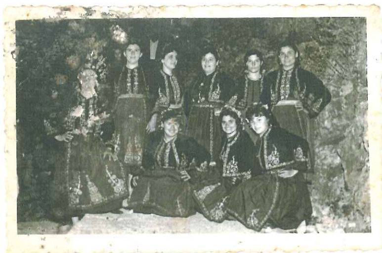
Φωτογραφία 10 : Γυναίκες του Γιρομεριού ντυμένες την «νυφική στολή»

Η νυφική στολή αποτελούνταν από: το γελέκι, τη σαρταμάκα , το φουστάνι και την ποδιά που έφεραν συμμετρικά κεντήματα με χρυσοκλωστή. Τα κεντήματα γίνονταν στα μανίκια, στο στήθος, στην ποδιά και στον ποδόγυρο του φουστανιού. Στο κεφάλι φορούσαν νυφικό μεταξωτό μαντήλι, με λεπτό χειροποίητο κέντημα τις μπιρμπίλιες (αναπαρίσταναν λουλούδια, φύλλα, καρπούς, πεταλούδες κλπ.). Το γλέντι τελείωνε ξημερώματα του Σαββάτου... κι έκλεινε με ταγκό!