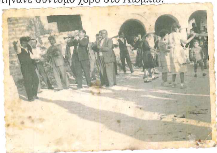
Φωτογραφία 6: Χορός στο Λιόμπιο, σε δυο κύκλους. Στον εξωτερικό κύκλο χορεύουν οι «μεγάλοι», στον εσωτερικό κύκλο οι «μικροί»

Την Κυριακή του Πάσχα , αφού τέλειωνε η ακολουθία της Αγάπης, οι χωριανοί στήνανε σύντομο χορό στο Λιόμπιο.