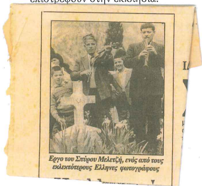
Έργο του Σπύρου Μελετζή, ενός από τους ελεγκτικότερους Έλληνες φωτογράφους

Την Δευτέρα του Πάσχα , το πρωί, όλοι οι χωριανοί κατηφορίζουν για την Αγία Σωτήρα, το νεκροταφείο του χωριού, για την Θεία Λειτουργία. Σε εντοιχισμένη πλάκα, στο δυτικό μέρος της εκκλησίας, είναι λαξευτό το έτος 1701! Αφού ανάψουν κεριά και προσκυνήσουν το εικονοστάσι της εκκλησίας, εξέρχονται για λίγο από αυτήν και πάνε στους οικογενειακούς τάφους να ανάψουν το καντήλι στα «πεθαμένα» τους. Αφήνουν δίπλα από αυτό, ένα κόκκινο πασχαλινό αυγό, τοποθετούν στο βάζο που υπάρχει πάνω στο μνήμα, μια ανθοδέσμη λουλούδια κι επιστρέφουν στην εκκλησία.