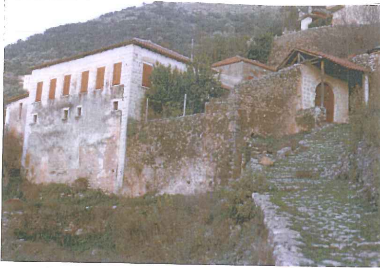
Φωτογραφία 5 : Δείγμα από ένα παραδοσιακό καλντερίμι

Το ίδιο «κακό» συντελέστηκε και με τα καλντερίμια του χωριού, που ξηλώθηκαν ή εξαφανίστηκαν καλυπτόμενα από μπετό! Ευτυχώς, κάποιοι κατανόησαν «το κακό» που έγινε κι προχωρούν σε πλακοστρώσεις, πλην όμως τα καλντερίμια...πεθάνανε !