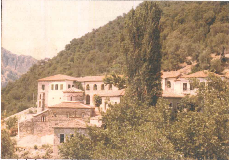
Φωτογραφία 1: Αποψη της Ι.Μ. Γιρομερίου

Αιώνες παλαιότερα, αναφέρονταν και ως Ιερομέριον, καταφανώς, λόγω της υπάρχουσας - σε απόσταση περίπου ενός χιλιομέτρου από το χωριό - Ιεράς Μονής Κοιμήσεως της Θεοτόκου Γηρομερίου (η μονή κράτησε και μετά το 1940 την παλαιά ορθογραφία).